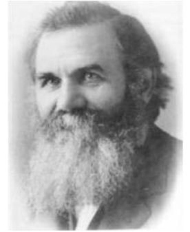
D. D. パーマー (1845-1913) カイロプラクティックの創始者

D.D.パーマーは 1845 年カナダ、オンタリオ州生まれ。アメリカで開業し、弟子への指導も行っていた。