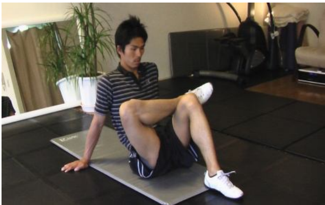
<お尻のストレッチ>

初めは硬く、きついものかもしれませんが、毎日継続していると気持ちよくなってきますので、まだストレッチを日常に取り入れていない方は試してみてください！！